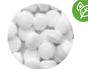
Caramelos de menta sin azúcar