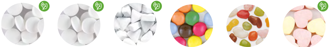
Caramelos de menta con dextrosa