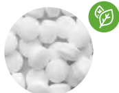
Caramelos de menta sin azúcar