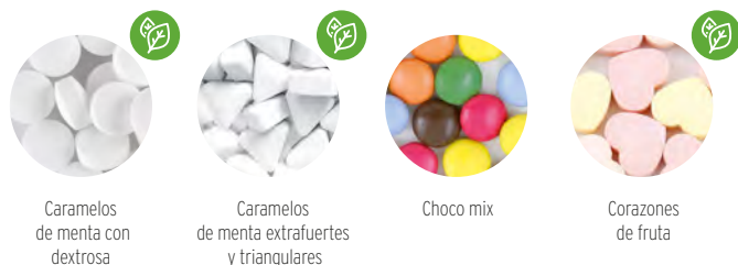
Caramelos de menta con dextrosa