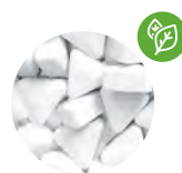
Caramelos de menta extrafuertes y triangulares