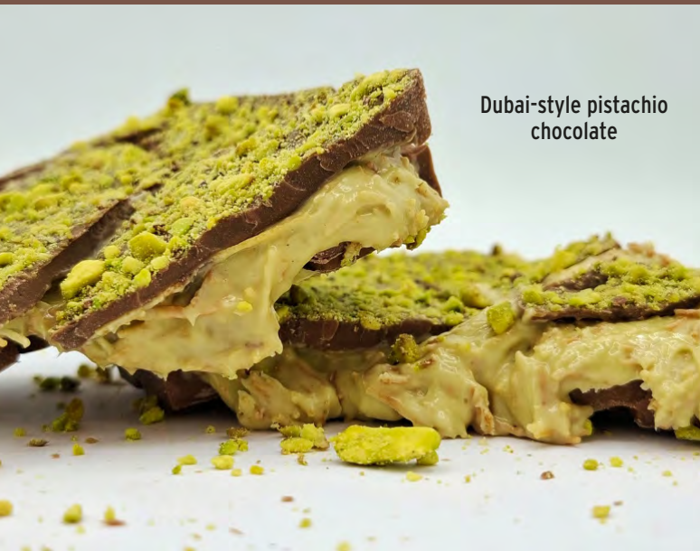
Dubai-style pistachio chocolate

Embalaje personalizable (cabe en el buzón).