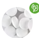
Caramelos de menta con dextrosa