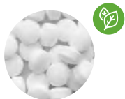
Caramelos de menta con dextrosa