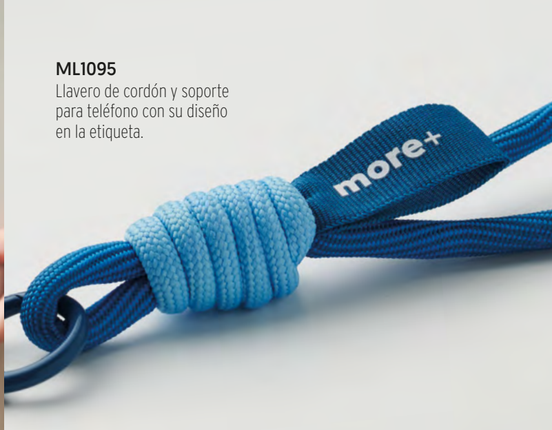
ML1095 Llavero de cordón y soporte para teléfono con su diseño en la etiqueta.