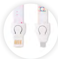
2 en 1 de USB-A a Micro-B