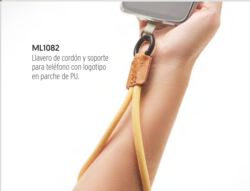
ML1082 Llavero de cordón y soporte para teléfono con logotipo en parche de PU.