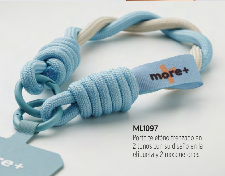
ML1097 Porta teléfono trenzado en 2 tonos con su diseño en la etiqueta y 2 mosquetones.