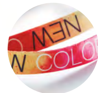
A todo color