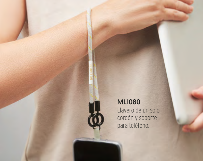
ML1080 Llavero de un solo cordón y soporte para teléfono.