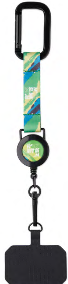
ML1087 Porta teléfono retráctil antipérdida con correa sublimada.