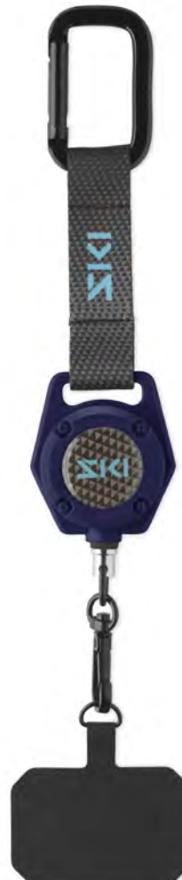
ML1089 Robusto porta-teléfono extensible con correa anticaída y antirrobo.