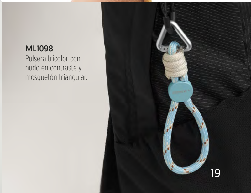
ML1098 Pulsera tricolor con nudo en contraste y mosquetón triangular.