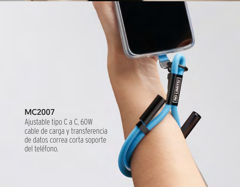
MC2007 Ajustable tipo C a C, 60W cable de carga y transferencia de datos correa corta soporte del teléfono.