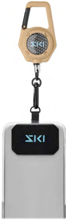
ML1088 Robusto porta-teléfono extensible anticaída y antirrobo.