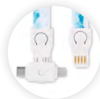
3 en 1 de USB-A a Micro-B y Tipo C